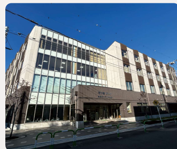
千川中学校の仮校舎となっている“学び舎びす”